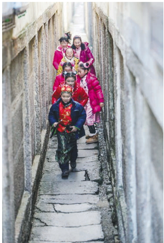
穿过岁月