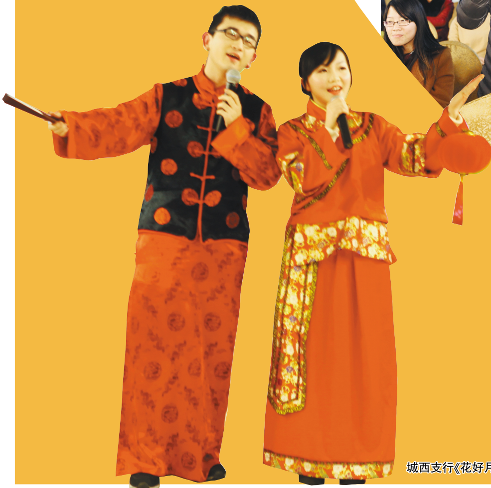
城西支行《花好月圆》

金羊舞,花灯俏,吉祥如意迎春到 迎春到,喜气高,又是一年闹元宵 闹元宵,月高照,千家万户欢笑 满载收获的喜悦,满怀奋进的豪情,我们送走了2014年。回首征途,胜利的笑容正在蔓延;携手今宵,高歌这一路荣耀感动。 一年来,在省农信联社和各级地方政府及监管部门的高度重视和深切关怀下,在总行领导班子的坚强带领下,在全体恒信人的共同努力下,全行上下同心协力、拼搏进取、开拓创新,各项工作取得新成效,服务水平迈上新台阶,普惠金融开创新局面!今夜,就让我们用歌声唱响春天的旋律,用舞步放飞农信的梦想。 让我们欢聚一堂,用歌声唱响发展的壮志! 让我们欢聚一堂,用舞蹈激起奋进的鼓点!