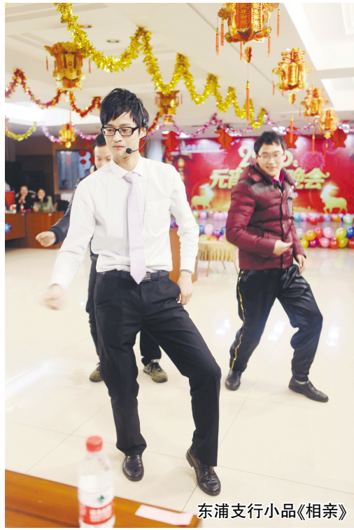
东浦支行小品《相亲》