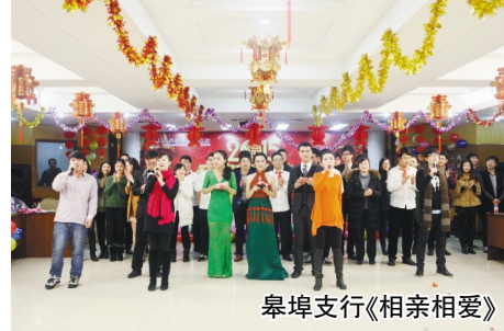
皋埠支行《相亲相爱》