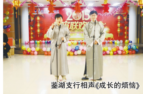
鉴湖支行相声《成长的烦恼》

金羊舞,花灯俏,吉祥如意迎春到 迎春到,喜气高,又是一年闹元宵 闹元宵,月高照,千家万户欢笑 满载收获的喜悦,满怀奋进的豪情,我们送走了2014年。回首征途,胜利的笑容正在蔓延;携手今宵,高歌这一路荣耀感动。 一年来,在省农信联社和各级地方政府及监管部门的高度重视和深切关怀下,在总行领导班子的坚强带领下,在全体恒信人的共同努力下,全行上下同心协力、拼搏进取、开拓创新,各项工作取得新成效,服务水平迈上新台阶,普惠金融开创新局面!今夜,就让我们用歌声唱响春天的旋律,用舞步放飞农信的梦想。 让我们欢聚一堂,用歌声唱响发展的壮志! 让我们欢聚一堂,用舞蹈激起奋进的鼓点!