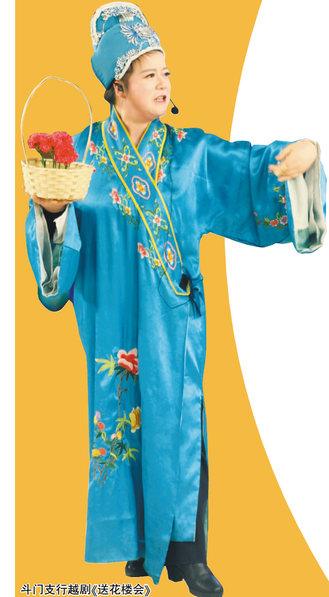
斗门支行越剧《送花楼会》