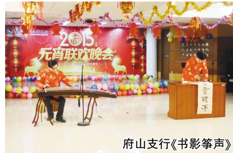
府山支行《书影箏声》