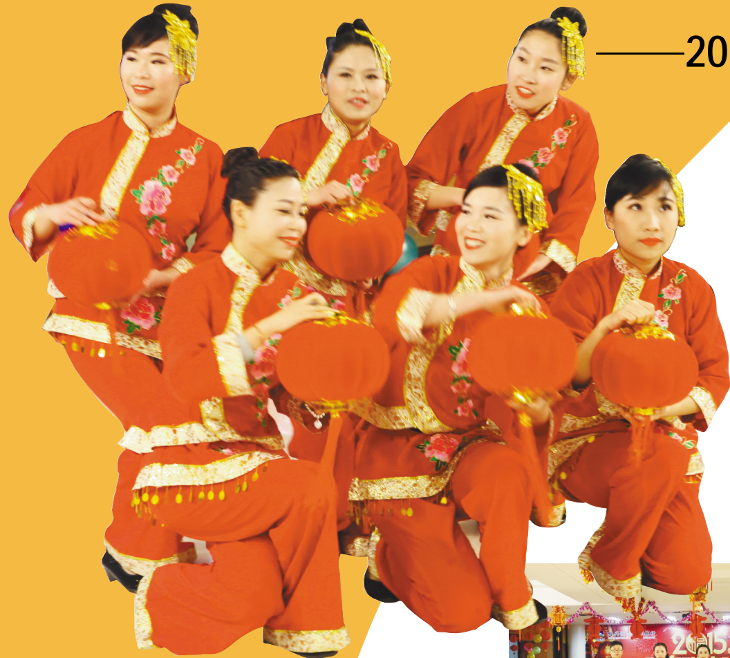
营业部舞蹈《好运来》